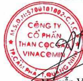
Nguyễn Văn Thuận