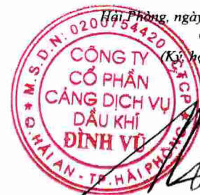
Đặng Kiến Nghiệp