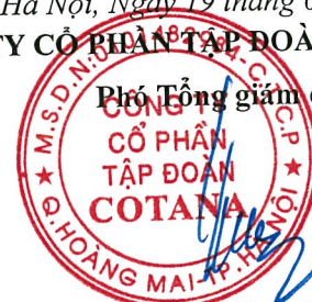
Trần Trọng Đại