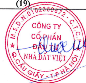
Trần Quốc Huy Chủ tịch HĐQT