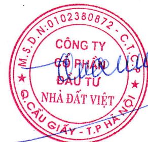
Trần Quốc Huy Chủ tịch HĐQT