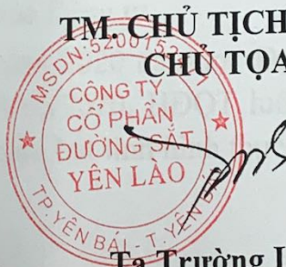
Tạ Trường Long