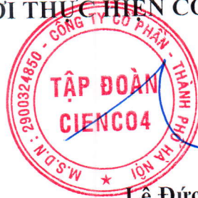
Lê Đức Thọ