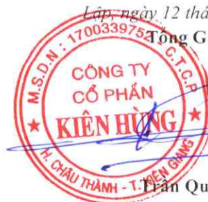
Trần Quốc Dũng