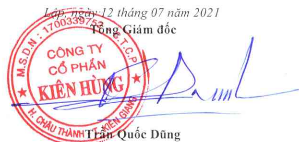
Trần Quốc Dũng