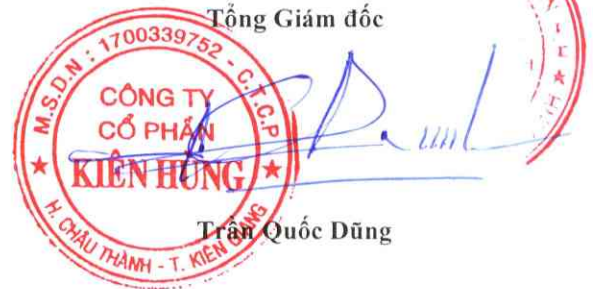
Trần Quốc Dũng