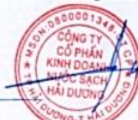
Phạm Minh Cường

(Các thuyết minh từ trang 09 đến trang 34 là bộ phận hợp thành của Báo cáo tài chính giữa niên độ này)