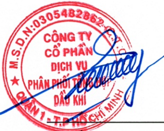
Vũ Tiên Dương Giám đốc

Người sử dụng báo cáo tài chính riêng giữa niên độ của Công ty nên đọc cùng với báo cáo tài chính hợp nhất của Công ty và các công ty con (gọi chung là "Nhóm công ty") cho kỳ 6 tháng kết thúc ngày 30 tháng 6 năm 2021 để có đủ thông tin về tình hình tài chính hợp nhất giữa niên độ, kết quả hoạt động kinh doanh hợp nhất giữa niên độ và tình hình lưu chuyển tiền tệ hợp nhất giữa niên độ của Nhóm công ty.