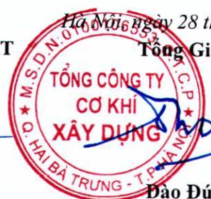
Đào Đức Thọ