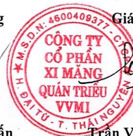
Trần Việt Cường