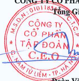
Đoàn Văn Minh

(Các thuyết minh từ trang 09 đến trang 42 là bộ phận hợp thành của Báo cáo tài chính giữa niên độ này)