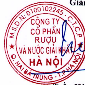
Trần Hậu Cường