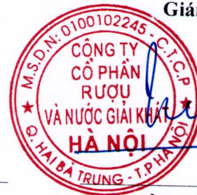
Trần Hậu Cường