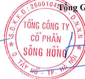
Lã Tuấn Hưng