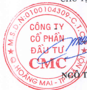
NGÔ TRỌNG VINH