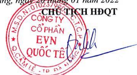
TRƯƠNG QUANG MINH