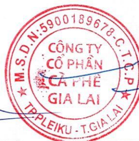
TRỊNH ĐÌNH TRƯỜNG Chủ tịch hội đồng quản trị