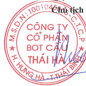
Ngô Tiến Cường