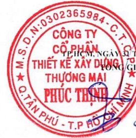
TỔ KHAI DẠY