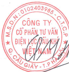
Quách Mỹ Hoa Chủ tịch HĐQT