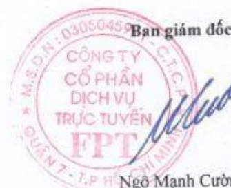
Ngô Mạnh Cường