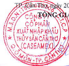
Võ Đông Đức