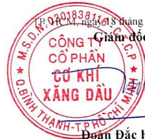
Đoàn Đắc Học