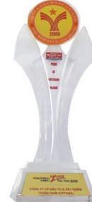
DANH HIỆU "THƯƠNG HIỆU MẠNH VIỆT NAM" năm 2005, 2006, 2007, 2008