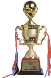
CÚP VÀNG Giải bóng đá truyền thống