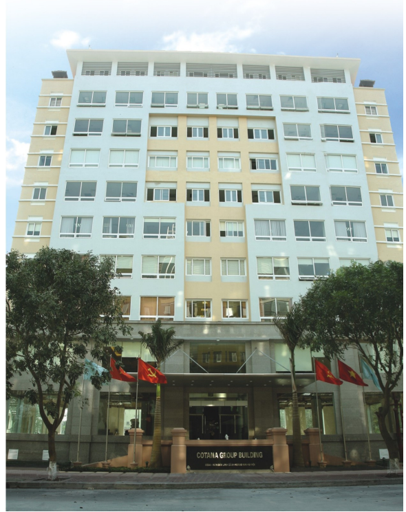
Trụ sở chính của COTANAGROUP

Công ty được chuyển đổi thành Công ty Cổ phần Đầu tư và Xây dựng Thành Nam, chính thức đi vào hoạt động theo Giấy chứng nhận đăng ký kinh doanh số 0103003621 ngày 04/02/2004 (đăng ký lần đầu). Ngày 26/08/2012 thay đổi lần thứ 13 theo Giấy chứng nhận đăng ký kinh doanh với mã số doanh nghiệp: 0101482984 do Sở Kế hoạch và Đầu tư thành phố Hà Nội cấp với số vốn điều lệ là 50.000.000.000 đồng.