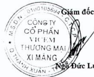
Đinh Xuân Cẩm