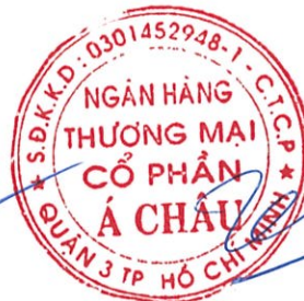
Trần Hùng Huy Chủ tịch Hội đồng Quản trị Ngày 28 tháng 2 năm 2018

Các thuyết minh từ trang 11 đến trang 89 là một phần cấu thành các báo cáo tài chính riêng này.