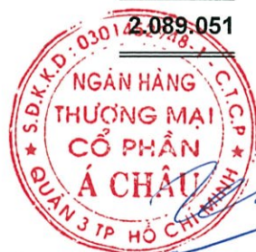
Trần Hùng Huy Trần Hùng Huy Chủ tịch Hội đồng Quản trị Ngày 28 tháng 2 năm 2018

Các thuyết minh từ trang 11 đến trang 89 là một phần cấu thành các báo cáo tài chính riêng này.