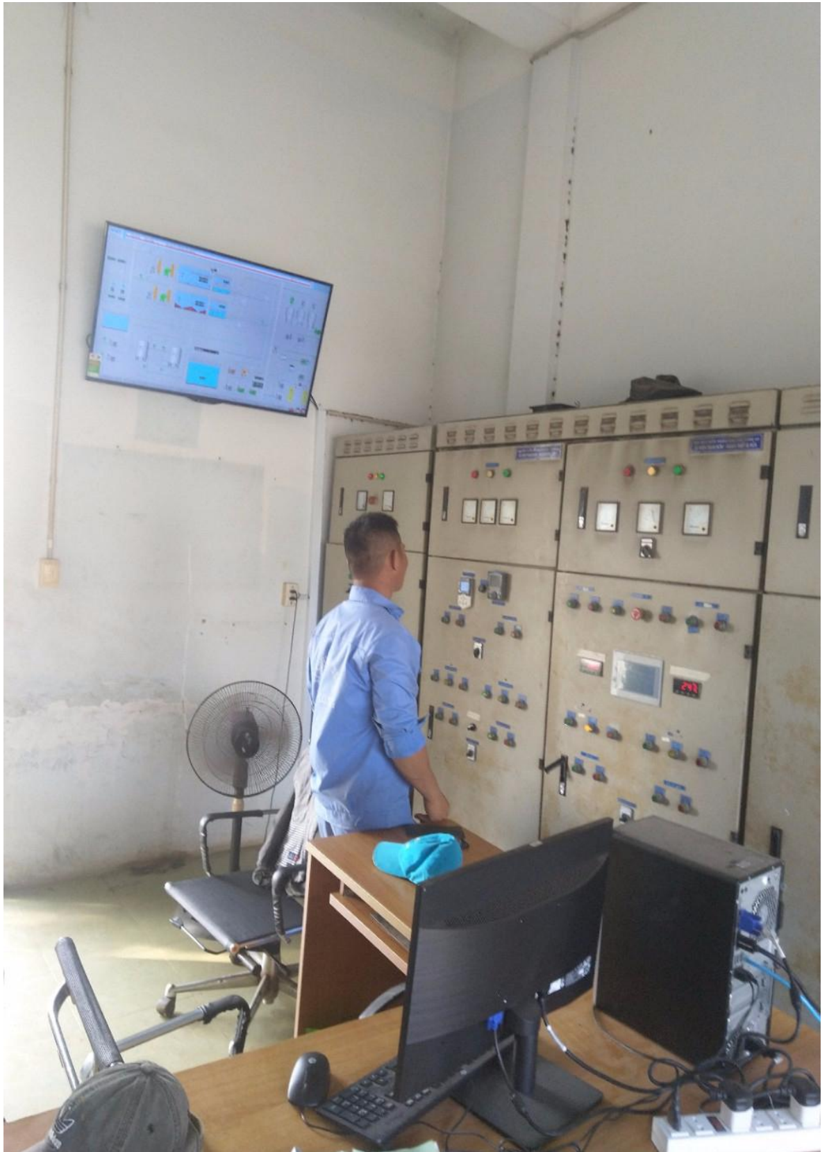
Nhân viên đang kiểm tra Hệ thống điều khiển nhà máy Nước