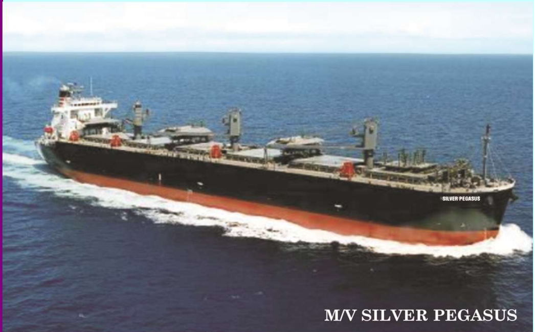
M/V SILVER PEGASUS