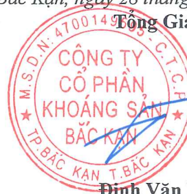
Đình Văn Hiến