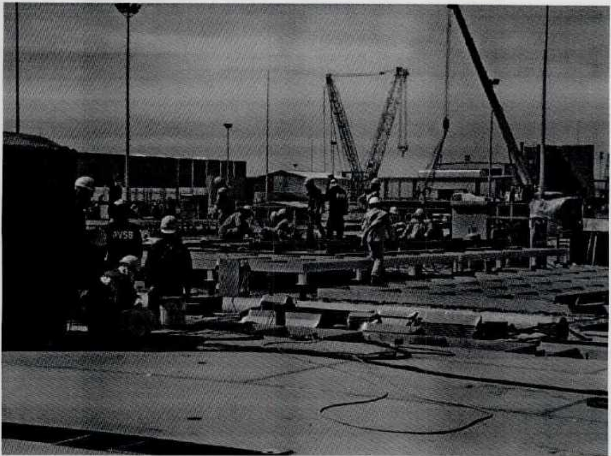
(Công nhân SMBĐ thi công chế tạo và lắp đặt các công trình cơ khí dầu khí đảm bảo an toàn)