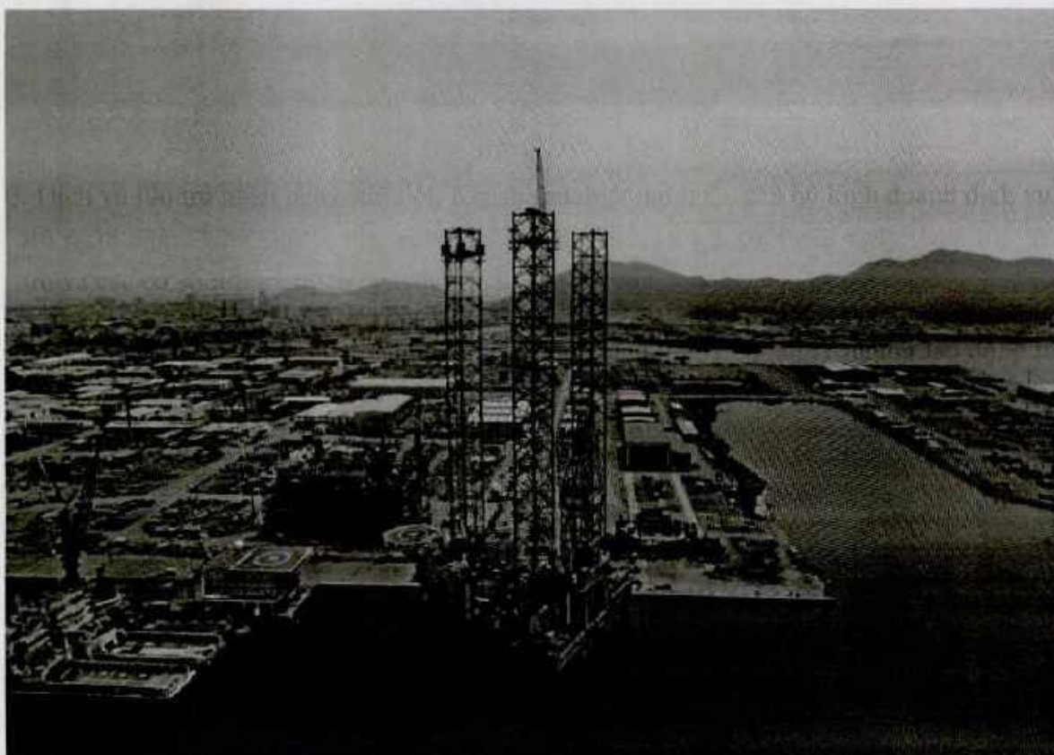
(Khu vực Cảng - Căn cứ Dịch vụ Hàng hải Dầu khí Sao Mai – Bến Đình hiện tại)

2.34. Cung ứng và quản lý nguồn lao động, chi tiết: Cung ứng và quản lý nguồn lao động trong nước, cung ứng và quản lý nguồn lao động đi làm việc ở nước ngoài;