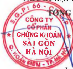
NGUYỄN CHÍ THÀNH