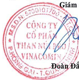
Đoàn Đắc Thọ