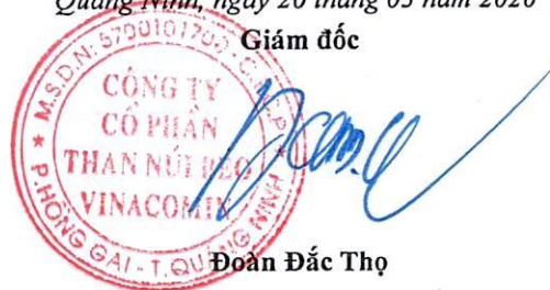
Đoàn Đức Thọ