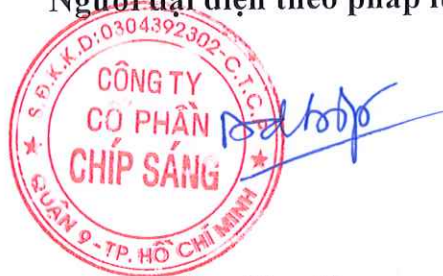
Đặng Duy Hợp