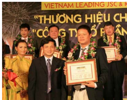
Đại diện Agriseco (hàng đầu bên phải) nhận cúp vàng và bằng khen của Ban tổ chức

Nhận Giải thưởng - Cúp vàng “Thương hiệu Chứng khoán Uy tín” trong Chương trình bình chọn “Thương hiệu Chứng khoán Uy tín” và “Công ty cổ phần hàng đầu Việt Nam” 2008 do Hiệp hội kinh doanh chứng khoán Việt Nam (VASB) khởi xướng và chủ trì tổ chức.