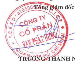
TRƯƠNG THÀNH NHÂN