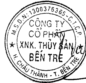
ĐẶNG KIẾT TƯỜNG