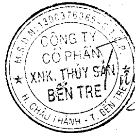
ĐẶNG KIẾT TƯỜNG Chủ tịch HĐQT

Xác nhận của đại diện theo pháp luật của Công ty