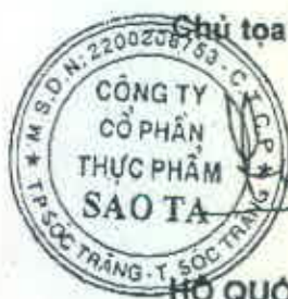
HỒ QUỐC LỰC