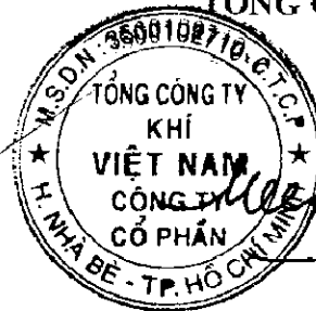
Đương Mạnh Sơn