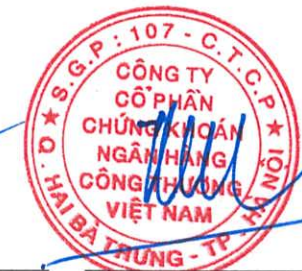
Trần Phúc Vinh Chủ tịch Hội đồng Quản trị