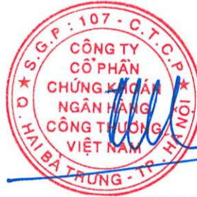
Trần Phúc Vinh Chủ tịch Hội đồng Quản trị