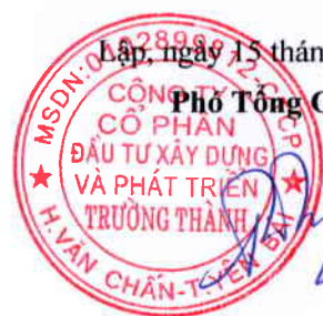
Trần Huyền Trang