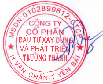
Trần Huyền Trang