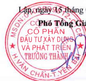
Trần Huyền Trang