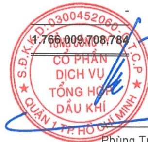
Phùng Tuấn Hà Chủ tịch HĐQT Ngày 15 tháng 3 năm 2025

Các thuyết minh từ trang 10 đến trang 58 là một phần cấu thành báo cáo tài chính hợp nhất này.