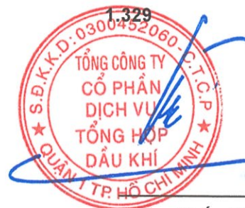
Phùng Tuấn Hà Chủ tịch HĐQT Ngày 15 tháng 3 năm 2025

Các thuyết minh từ trang 10 đến trang 58 là một phần cấu thành báo cáo tài chính hợp nhất này.