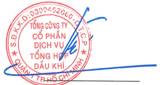
Phùng Tuấn Hà Chủ tịch HĐQT Ngày 15 tháng 3 năm 2025

Các thuyết minh từ trang 10 đến trang 58 là một phần cấu thành báo cáo tài chính hợp nhất này.