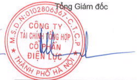
Trương Tuấn Đạt