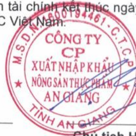
Chủ tịch HĐQT