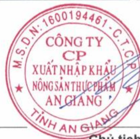
Chủ tịch HĐQT