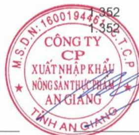
Chủ tịch HĐQT