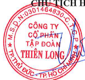
CÔ GIA THỌ