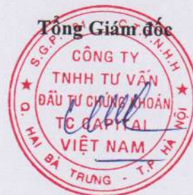
Đặng Quốc Hùng