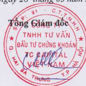
Đặng Quốc Hùng