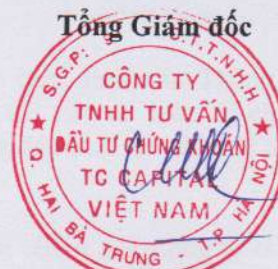
Đặng Quốc Hùng