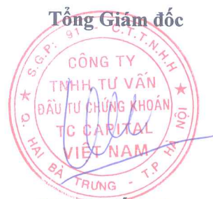
Đặng Quốc Hùng