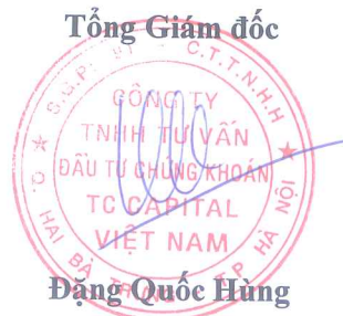
Đặng Quốc Hùng