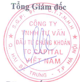
Đặng Quốc Hùng