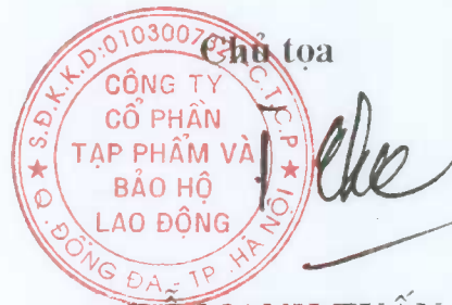
ĐỖ MẠNH TUẤN