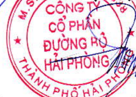
Triệu Hạo Nhiên