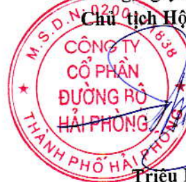
Triệu Hạo Nhiên