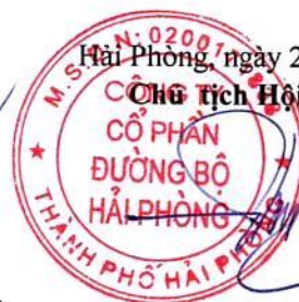
Triệu Hạo Nhiên