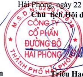
Triệu Hạo Nhiên