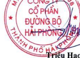
Triệu Hạo Nhiên