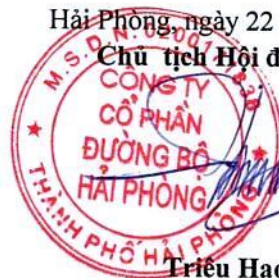
Triệu Hạo Nhiên